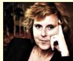
Connie Hedegaard, komisarka za podnebne ukrepe

Na čelu resorja za energetiko je Nemeec Günther Oettinger, po poklicu pravnik. Preden je prevzel položaj evropskega komisarja, je bil od 2005 predsednik vlade nemške zvezne dežele Baden-Württemberg. Pred tem je imel uspešno pravniško kariero. Poleti 2008 je postal častni pokrovitelj pobude »Radi imamo Afriko«, namenjene izboljšanju življenja otrok na tej celini.