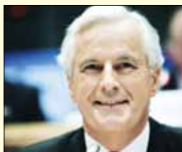
Michel Barnier, komisar za notranji trg in storitve

Finec Olli Rehn je področje širitve v okviru prve Barrosove komisije zamenjal z resorjem za ekonomske in denarne zadeve. Svojo politično kariero je začel leta 1988 kot mestni svetnik v Helsinkih. Pred prihodom v Bruselj je bil svetovalec finskega premiera za gospodarsko politiko, kratek čas pa je bil tudi član Prodijeve komisarske ekipe. Rehn je doktoriral iz filozofije na univerzi v Oxfordu in poleg finskega jezika govori še angleško, francosko, švedsko in nemško.