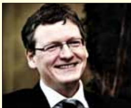
László Andor , komisar za zaposlovanje, socialne zadeve in vključevanje

Madžar László Andor bo kot novinec v tokratni zasedbi Komisije skrbel za resor za zaposlovanje, socialne zadeve in vključevanje. Ekonomist, izredni profesor ter urednik revije za socialno kritiko in kulturo Eszmélet je bil od leta 2005 član upravnega odbora direktorjev Evropske banke za obnovo in razvoj v Londonu. Pred tem je bil med letoma 2003 in 2005 svetovalec v kabinetu madžarskega premiera, najprej Pétra Medgyessyja in nato Ferenc Gyurcsányja.