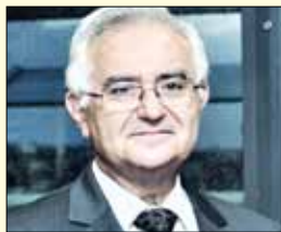
John Dalli , komisar za zdravje in varstvo potrošnikov

Resor za kmetijstvo in razvoj podeželja vodi romunski inženir hortikulture in politik Dacian Cioloș ki je komisarski položaj zasedel prvič. Področje pozna, saj je bil v letih 2007 in 2008 romunski kmetijski minister, pred tem pa državni podsekretar za evropske zadeve na ministrstvu za kmetijstvo in razvoj podeželja.