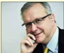
Olli Rehn, komisar za ekonomske in monetarne zadeve

Štefan Füle, zadolžen za resor za širitev, je nekdanji češki veleposlanik v Litvi in Veliki Britaniji. Diplomata in politik se je izobraževal na Karlovi univerzi v Pragi (na fakulteti za filozofijo) in moskovskem državnem inštitutu za mednarodne odnose. V času prehodne vlade Jana Fischerja je bil minister za evropske zadeve, pred tem pa vodja češkega predstavništva pri Natu.