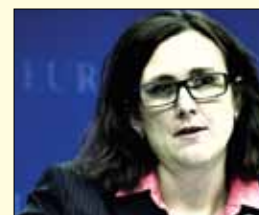
Cecilia Malmström , komisarka za notranje zadeve

Poljak Janusz Lewandowski je odgovoren za resor za finančno načrtovanje in proračun. Lewandowski, doktor ekonomskih znanosti, je bil od leta 2004 poslanec Evropskega parlamenta in predsednik parlamentarnega odbora za proračun, v začetku 90. let prejšnjega stoletja pa poljski minister za privatizacijo.