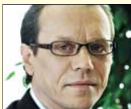
Algirdas Šemeta, komisar za obdavčenje carinsko unijo, revizijo in boj proti goljufijam

Latvijec Andris Piebalgs je resor za energetiko zamenjal za resor za razvoj. Piebalgs, diplomirani fizik, je bil pred tem latvijski finančni in šolski minister ter član parlamenta in veleposlanik v Estoniji. Ko je bila Latvija še del Sovjetske zveze, je Andris Piebalgs delal kot učitelj in ravnatelj srednje šole.