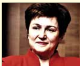
Kristalina Georgieva , komisarka za mednarodno sodelovanje, humanitarno pomoč in krizno odzivanje

Resor za raziskave in inovacije je dodeljen Irki Máire Geoghegan-Quinn. Irska političarka, po izobrazbi učiteljica, ima bogate izkušnje kot članica Evropskega računskega sodišča, v prvi polovici 90. let prejšnjega stoletja je bila irska ministrica za pravosodje ter za promet in turizem, pred tem pa ministrica za evropske zadeve. Je tudi avtorica romana «The Green Diamond» (Zeleni diamant), nekaj časa pa je bila kolumnistka časnika The Irish Times .