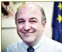
Joaquín Almunía, podpredsednik Evropske komisije in komisar za konkurenco