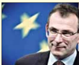
Andris Piebalgs, komisar za razvoj

V novem mandatu prihaja tudi do nekaterih sprememb glede resorjev. Področje pravosodja in notranjih zadev je po novem razdeljeno na pravosodje in temeljne pravice ter na notranje zadeve, kar spominja na nacionalne ureditve v državah članicah. Poleg tega smo z letom 2010 dobili tudi komisarko za podnebne ukrepe, torej resor, ki ga do zdaj ni bilo. Resor za večjezičnost je po novem združen s kulturo, združena sta tudi sedanja resorja za zaščito potrošnikov in za zdravje. Poleg tega so preoblikovani še nekateri drugi resorji, kot so industrija in podjetništvo, raziskave in inovacije ter mednarodno sodelovanje, humanitarna pomoč in krizno odzivanje. Politiki socialnega vključevanja bo namenjena pozornost v okviru resorja za zaposlovanje, socialne zadeve in vključevanje, z resorjem digitalna agenda pa je znova v ospredju tudi informacijska družba.