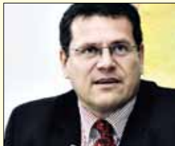
Maroš Šefčovič, podpredsednik Evropske komisije in komisar za medinstitucionalne odnose in administrativne zadeve

Podpredsednica Komisije je postala tudi Luksemburžanka Viviane Reding, ki bo v prihodnjih petih letih na čelu resorja za pravosodje, temeljne pravice in državljanstvo. Redingova je med najbolj izkušenimi člani Evropske komisije, saj je to že njen tretji komisarski mandat. V prvi Barrosovi ekipi je bila pristojna za informacijsko družbo in medije, pred tem pa za izobraževanje, kulturo, mladino, medije in šport. Redingova, ki je bila pred odhodom v politiko novinarka, je znana predvsem po ukrepih, s katerimi je Komisija dosegla znižanje cen mobilnega gostovanja v drugi državi članici EU. Bila je tudi poslanka v Evropskem parlamentu.