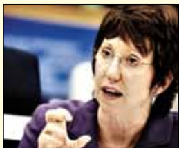
Catherine Ashton, prva podpredsednica Evropske komisije in visoka predstavnica Unije za zunanje zadeve in varnostno politiko

Portugalec José Manuel Barroso je bil septembra 2009 že drugič izvoljen za predsednika Evropske komisije. Nekdanji premier Portugalske ima za sabo pestro politično kariero, na čelo Evropske komisije pa je prišel leta 2004, ko je nasledil Italijana Romana Prodiya. Če bo svoj drugi mandat uspešno dokončal, bo po Francozu Jacquesu Delorsu postal drugi predsednik Evropske komisije, ki je služil dva mandata.