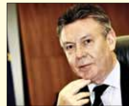
Karel De Gucht , komisar za trgovino

Grkinja Maria Damanaki, ki je na čelu resorja za ribištvo in pomorske zadeve, je novinka v Komisiji. S 25 leti je postala najmlajša članica grškega parlamenta, od leta 2004 do 2009 pa je bila članica Evropskega parlamenta. Damanakijeva, ki ima magisterij iz kemijskega inženirstva, je tudi avtorica štirih knjig, med njimi dela Ženski vidik moči , v katerem raziskuje sodelovanje žensk v procesih odločanja, in primerjalne študije institucionalnega okvira EU, ki nosi naslov Vrnitev politike – evropski pogled .