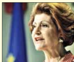
Androulla Vassiliou, komisarka za izobraževanje, kulturo, večjezičnost in mlade

Litovec Algirdas Šemeta je bil od julija lani v Evropski komisiji pristojen za proračun, v novi Komisiji pa vodi resor za obdavčenje, carinsko unijo, revizijo in boj proti goljufijam. Algirdas, po izobrazbi ekonomist-matematik, je bil pred tem litovski finančni minister v dveh mandatih.