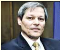
Dacian Cioloș , komisar za kmetijstvo in razvoj podeželja

Madžar László Andor bo kot novinec v tokratni zasedbi Komisije skrbel za resor za zaposlovanje, socialne zadeve in vključevanje. Ekonomist, izredni profesor ter urednik revije za socialno kritiko in kulturo Eszmélet je bil od leta 2005 član upravnega odbora direktorjev Evropske banke za obnovo in razvoj v Londonu. Pred tem je bil med letoma 2003 in 2005 svetovalec v kabinetu madžarskega premiera, najprej Pétra Medgyessyja in nato Ferenc Gyurcsányja.