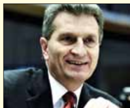
Günther Oettinger, komisar za energetiko

Francoz Michel Barnier bo pristojen za notranji trg in storitve. Barnier se je tako vrnil v Evropsko komisijo; že med letoma 1999 in 2004 je bil namreč kot evropski komisar pristojen za regionalno politiko, 2004 je postal francoski minister za zunanje zadeve, tri leta kasneje pa minister za kmetijstvo in ribištvo. Ta položaj je zapustil leta 2009, ko je bil izvoljen v Evropski parlament. Barnier je kot sopredsednik olimpijskega komiteja skupaj z nekdanjim francoskim alpskim smučarjem Killyjem leta 1992 sodeloval pri organizaciji zimskih olimpijskih iger v Albertvillu.