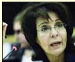
Maria Damanaki , komisarka za ribištvo in pomorske zadeve

Resor za zdravje in varstvo potrošnikov vodi Maltežan John Dalli. Kot računovodja je Dalli sprva delal v zasebnem sektorju na Malti in v tujini, s politiko pa se je začel dejavno ukvarjati leta 1997, ko je bil prvič izvoljen v predstaviški dom. Nato je služboval kot državni sekretar za industrijo, malteški minister za gospodarske zadeve in za finance, minister za zunanje zadeve in minister za spodbujanje naložb. Od marca 2008 je bil minister za socialno politiko.