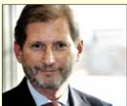
Johannes Hahn , komisar za regionalno politiko

Belgijec Karel De Gucht že ima izkušnje z delom v Evropski komisiji. Resor za razvoj in humanitarno pomoč, ki ga je vodil od leta 2009, je zamenjal s položajem komisarja za trgovino. Gucht, diplomirani pravnik, je bil pred tem podpredsednik belgijske vlade, minister za zunanje in evropske zadeve ter minister za mednarodno trgovino.