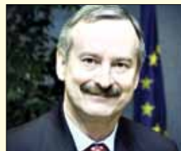
Siim Kallas, podpredsednik Evropske komisije in komisar za promet

Španec Joaquín Almunía bo prihodnjih pet let zadolžen za področje konkurence, je pa tudi eden od podpredsednikov druge Barrosove ekipe. V njegovi prvi ekipi je bil pristojen za gospodarske in denarne zadeve, v spominu pa nam je ostal predvsem iz obdobja, ko je Slovenija prevzemala evro. Leta 2000 se je Almunía, diplomirani ekonomist in pravnik, kot kandidat španskih socialistov potegoval tudi za položaj predsednika vlade.