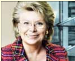
Viviane Reding, podpredsednica Evropske komisije in komisarka za pravosodje, temeljne pravice in državljanstvo