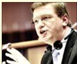
Štefan Füle, komisar za širitev in evropsko sosedsko politiko

Ena od misli iz Barrosovega 41-stranskega programa za prihodnjih pet let dela Evropske komisije.