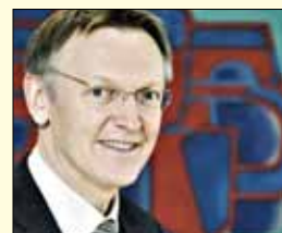
Janez Potočnik, komisar za okolje

Ciprčanka Androulla Vassiliou je v novi Komisiji na čelu resorja za izobraževanje, kulturo, večjezičnost in mlade. Od leta 2008 je bila komisarka za zdravje, pred tem pa več mandatov članica ciprskega parlamenta, kot prva dama Cipra v letih od 1988 do 1993 pa je bila zelo dejavna na kulturnem in socialnem področju. Vassilioujeva je v Veliki Britaniji študirala pravo in mednarodne odnose.