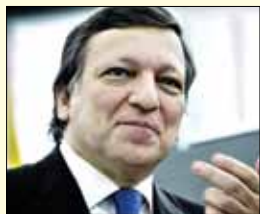
José Manuel Barroso, predsednik Evropske komisije

V nadaljevanju vam predstavljamo evropske komisarke in komisarje, novosti, ki jih prinaša tokratni mandat Evropske komisije, ter njene prednostne naloge.