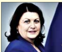
Máire Geoghegan-Quinn , komisarka za raziskave in inovacije

Za regionalno politiko je po novem odgovoren Avstrijec Johannes Hahn, ki je pred tem opravljal naloge avstrijskega ministra za znanost in raziskave. Kot minister si je med drugim prizadeval za popularizacijo znanosti in ozaveščanje o dosežkih znanstvenic. Hahn, novinec v Evropski komisiji, je doktoriral iz filozofije, pet let pa je bil tudi član dunajske regionalne vlade.