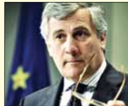
Antonio Tajani, podpredsednik Evropske komisije in komisar za industrijo in podjetništvo

Podpredsednik Komisije je tudi Slovak Maroš Šefčovič, pristojen za področje medinstitucionalnih odnosov in administrativnih zadev. Član Evropske komisije je postal oktobra 2009, ko je zamenjal Jana Figla in prevzel področje izobraževanja, usposabljanja, kulture in mladine. Pred tem je bil slovaški veleposlanik v Izraelu in vodja stalnega predstavništva Slovaške pri EU.