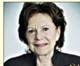
Neelie Kroes, podpredsednica Evropske komisije in komisarka za digitalno agendo

Estonec Siim Kallas bo v prihodnjih petih letih komisar za promet in je eden od podpredsednikov Barrosove ekipe. Tudi Kallas ni novinec, saj je bil od leta 2004 komisar za administrativne zadeve in boj proti goljufijam. V letih 2002 in 2003 je bil estonski premier, pred tem pa estonski minister za finance in tudi minister za zunanje zadeve.